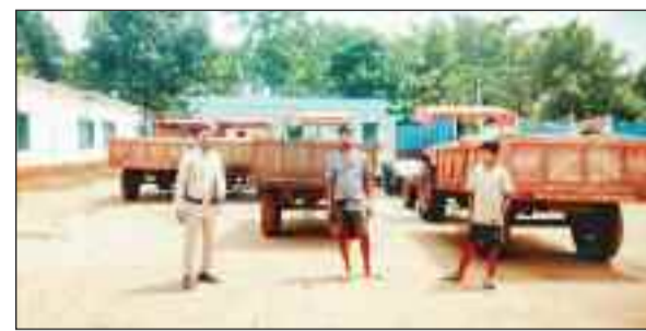
अवैध उत्खनन में लगे जैट ट्रैक्टर।