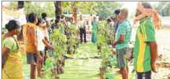
पौधा वितरण करते वन विभाग का अमला।

जशपुरनगर। प्रधानमंत्री जनजाति आदिवासी न्याय महाअभियान पीएम जनमन योजना अंतर्गत जशपुर जिले में निवास करने वाले निराश्रित विधवाओं को लाभान्वित