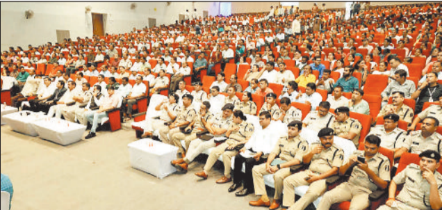
कार्यशाला में शामिल विभागीय अधिकारी व कर्मचारी।