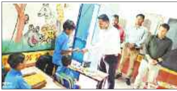
कौपी किताब पेन वितरण करते शिक्षक।