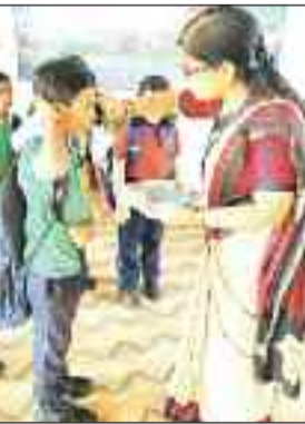
नवप्रवेशी बच्चे का तिलक लगाकर अभिनंदन।

जशपुरनगर। बुधवार 26 जून को स्कूलों की गर्मी की छुट्टियां समाप्त हो गईं। यहां के डीपीएस हायर सेकेंडरी एवं डीपीएस प्रायमरी बालाजी में विद्यार्थियों के आगमन के साथ ही नवीन शिक्षण सत्र का प्रारंभ हो गया। दोनों स्कूलों में छुट्टियों के बाद प्रथम दिवस विद्यार्थियों का तिलक लगाकर प्रवेश करवाया गया। वहीं स्कूल प्रबंधन द्वारा विद्यार्थियों से शैक्षिक संवाद कर विद्यार्थियों को विद्यालय आने के लिए प्रोत्साहित किया गया। विद्यालय शुरू होने के पहले दिन विद्यार्थियों में भी खासा उत्साह दिखाई दिया। नए शिक्षा सत्र के पहले दिन प्रवेश उत्सव को लेकर दोनों स्कूलों में तैयारियां की गई थीं। स्कूल की रंग-बिरंगे बैंगलुन से सजाकर बुधवार को शाला प्रवेशोत्सव मनाया गया। इस दौरान विद्यालय की शिक्षिकाओं द्वारा बच्चों को तिलक लगाकर, बालिकाओं को कुमकुम की बिंदी लगाकर उनका स्वागत किया गया। जिसके बाद वेलकम सॉन्ग हुआ और नियमित प्रेरण के बाद कक्षाओं में पढ़ाई हुई।