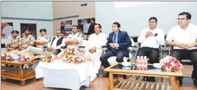
भारतीय न्याय संहिता पर कार्यशाला में उपस्थित अतिथि।

सारंगढ़। राष्ट्रीय विधिक सेवा प्राधिकरण नालसा नई दिल्ली द्वारा 13 जुलाई 2024 को सभी मामलों पर नेशनल लोक अदालत का आयोजन किया जाना निर्धारित किया है। सिविल और राजस्व न्यायालयों में लम्बित राजीनामा योग्य अपराधिक मामले, चेक बाउन्स के मामले, पारिवारिक विवाद, मोटर दुर्घटना दावा एवं व्यवहार प्रकृति के मामलों, जिसमें निष्पादन प्रकरण भी सम्मिलित हैं, के अलावा, भूमि अधिग्रहण, आबकारी, श्रम, विद्युत, टेलीफोन सम्बन्धी प्रकरण बैंक रिकवरी के राजीनामा हेतु रखे जायेंगे, जिसमें मुकद्दा पूर्व वाद भी लोक अदालत में प्रस्तुत कर राजीनामा के द्वारा निराकृत किया जा सकता है। इसके अतिरिक्त धारा 188 भादप्रसंग एवं कोविड-19 के परिप्रेक्ष्य में आपदा प्रबन्धन अधिनियम 2005 एवं अन्य छोटे अपराधों के मामलों जिसमें यातायात उल्लंघन के मामलों को भी शामिल कर निराकृत किये जायेंगे। विगत लोक अदालत की भांति राजस्व न्यायालय के प्रकरणों के संबंध में भी 13 जुलाई को खण्डपीठों का गठन करते हुए, खातेदारों के मध्य आपसी बंटवारे वारिसों के मध्य बंटवारे वादादरत के आधार पर बंटवारे कब्जे के आधार बंटवारे के प्रकरण दण्ड प्रक्रिया संहिता की धारा 145 की कार्यवाही आदि मामले रखे जाएंगे। के मामले भाड़ा नियंत्रण सम्बन्धी, सुखाधिकार सम्बन्धी, विक्रयपत्र, दानपत्र, वसीयतनामा के आधार पर नामान्तरण के मामले तथा अन्य राजीनामा योग्य मामले रखे जाएंगे।